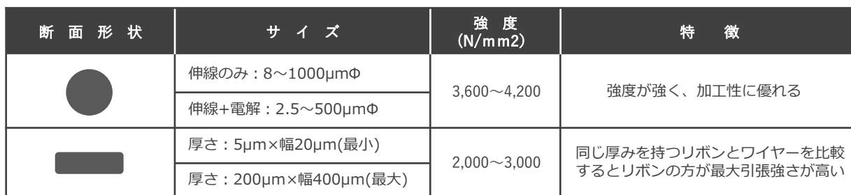
タングステン線およびリボンの形状と強度